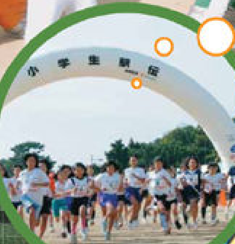
(写真は昨年の大会より)