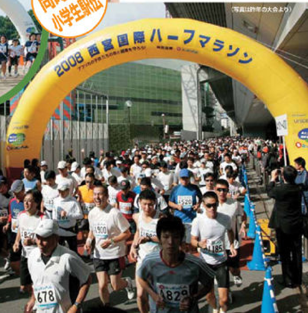
(写真は昨年の大会より)