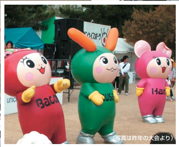
(写真は昨年の大会より)

ユニセフカップ 2009 西宮国際ハーフマラソン アフリカの子供たちの命と健康を守ろう! 特別協賛 ニッポンハム