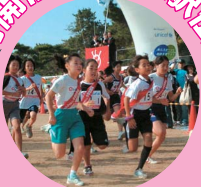
(写真は昨年の大会より)