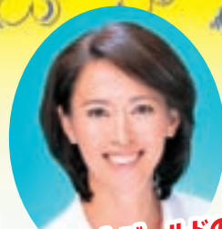
ハート・オブ・ゴールドの 有森裕子代表